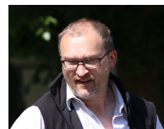
unsere Führer durch die Mühle

Für unsere kleinen bzw. jungen Besucher gibt es eine Hüpfburg, Bastelaktionen und mehr. Lasst Euch überraschen. Weitere Informationen zur Mühle und zum Fest gibt es unter www.tueshaus-muehle.de und auf unserer Facebook-Seite.